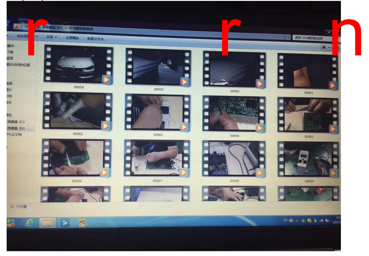
Complete procedure shown as below thumbnail